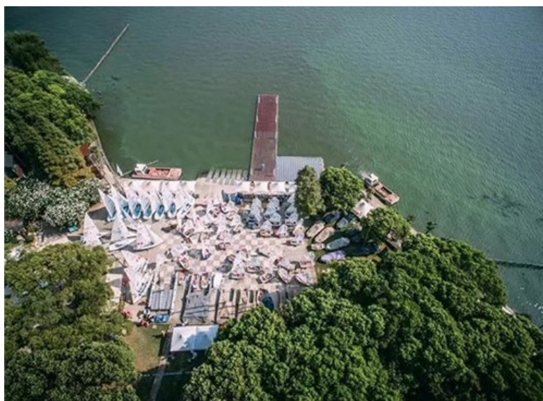
图 2 上海美帆游艇俱乐部码头实景图