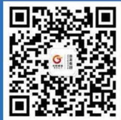
日照体育发展集团